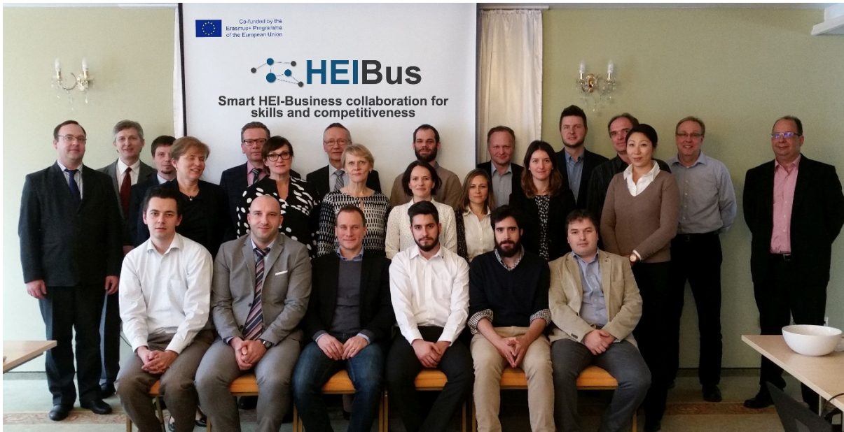
Kuva 1. HEIBus-projektin partnerit käynnistyspalaverissa 23.-25.1.17 Miskolcissa Unkarissa

Jyväskylän ammattikorkeakoulussa (JAMK) on käynnistynyt Erasmus + Knowledge Alliances 2 – ohjelmaan kuuluva projekti nimeltään ”Smart HEI-Business collaboration for skills and competitiveness” (HEIBus). Projekti kestää kolme vuotta (1.1.17 – 31.12.19) ja sen kokonaisbudjetti on 989 k€. Projektin tavoitteena on kehittää uusia innovatiivisia menetelmiä eurooppalaisten korkeakoulujen ja yritysten yhteistyölle. Projektin käynnistyspalaveri pidettiin tammikuussa 2017 Miskolcissa Unkarissa (kuva 1).