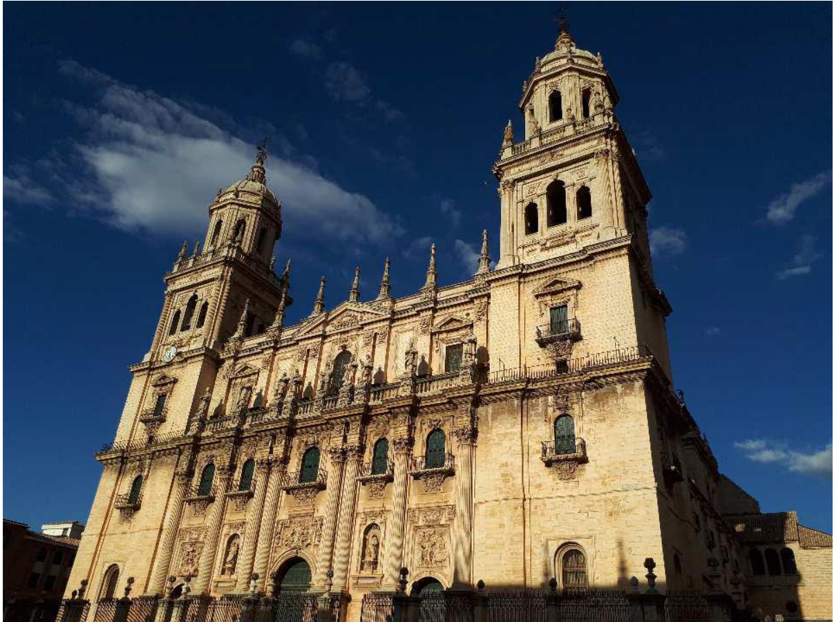
Kuva 4. Jaenin vanha katedraali

Intensiiviweekin jälkeen opiskelijat työskentelevät omissa korkeakouluissaan ja pitävät yhteyttä muihin tiimin jäseniin virtuaalisesti. Projekti päättyy joulukuussa 2017, jolloin tiimit laativat loppuraportin ja pidetään loppuseminaari, johon espanjalaiset osallistuvat fyysisesti ja muut etäyhteyden kautta.