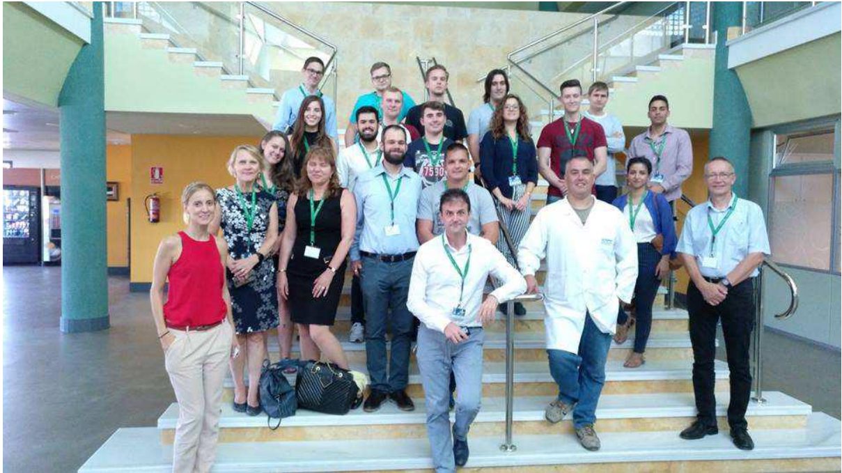
Kuva 1. Andaltec –projektin opiskelijoita ja opettajia

Smart HEI-Business collaboration for skills and competitiveness (HEIBus) –hankkeen työpaketin WP3 “Multidisciplinary Real Life Problem Solving (RLPS)” Andaltec –pilottiprojektin intensiiviviikko pidettiin Jaenissa Espanjassa 2-6 lokakuuta 2017. Projektiin osallistui 18 opiskelijaa ja 11 opettajaa Jaenin ja Miskolcin yliopistoista ja Jyväskylän ammattikorkeakoulusta (kuva 1).