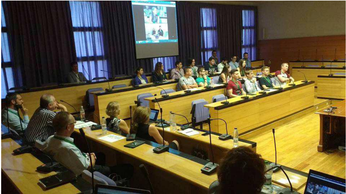
Kuva 2. Luennon seuranta